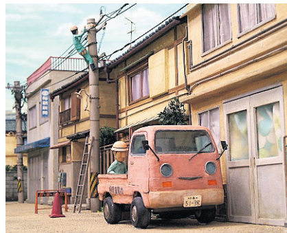
In «Elemi» verliebt sich ein Telefonmast in einen Elektriker.