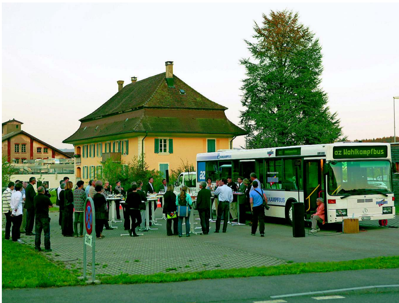
Sechs Nationalratskandidaten diskutierten auf dem Podium Umwelt- und Verkehrsfragen.

Verursacher überhaupt kennt.» Dieser Argumentation stimmten die andern bei. Kirchhofer führte die Diskussion weiter zum Umgang mit Abfall im Kleinen. Was die Kandidaten denn von flächendeckendem Pfand bei PET-Flaschen und Verpackungen hielten, wollte er wissen. Thomas