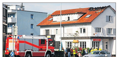
RASCH GELÖSCHT Beschädigtes Dach. 10

im Müllerhaus. Alle Geschichten sind im Schloss Hallwyl aufgelegt und werden im Internet veröffentlicht: www.koenig-artus.ch. Das Schreibturnier wurde unterstützt vom Aargauer Kuratorium und Soroptimist Freiamt.