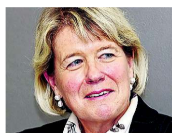
Notfalls Anbindung an Euro

Wir erfahren nun, welch kleines Rädchen die Schweiz im globalen Wirtschaftsgefüge ist – trotz schlagkräftiger Wirtschaftsleistung und fleissiger Menschen. Zum Schutz der Arbeitsplätze, unseres Arbeitsplatzes und unserer erfolgreichen und innovativen Exportwirtschaft befürworte ich als letzte Massnahme auch die Anbindung des Frankens an den Euro. So schnell wie möglich sollten die Konsumenten vom tiefen Euro auf importierte Güter profitieren können.