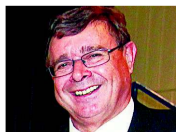
Ausweg: Geld drucken

Masslos überschuldete EU-Staaten und die USA haben unseren stolzen Franken zu stark gemacht. Die Eurokäufe der SNB 2010 von 191 Milliarden Franken bei einem Kurs von Fr. 1.45 waren überstürzt und wirkungslos. Heute ist der hoch überbewertete Franken ein Grossrisiko für Industrie und Gewerbe, aber auch für die Löhne und Pensionskassen. Die SNB ist gefordert. Da ihr bald die Eigenmittel fehlen, ist milliardenweises Geld drucken wahrscheinlich der einzige Ausweg.