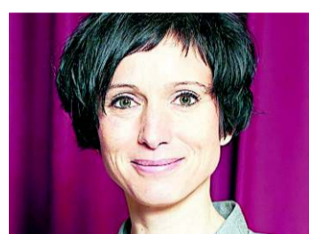
Druck auf Importbranche

Jeder muss dort handeln, wo er kann und zuständig ist. Für das Parlament steht also nicht die Geldpolitik der unabhängigen SNB im Zentrum, sondern der Handlungsspielraum von Weko und Preisüberwacher: Wer von Währungsgewinnen profitiert, muss diese weitergeben. Das entlastet Exportindustrie, Tourismus, die dort tätigen Angestellten und Konsumenten. Dafür braucht es eine sofortige Praxisänderung der viel zu zurückhaltenden Weko und eine Verschärfung des Kartellgesetzes.