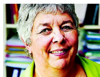
Kurs von 1.30 verteidigen

Die SNB muss mit ihrer Geldpolitik einen fixen Wechselkurs von mindestens Fr. 1.30 verteidigen. Die Währungsgewinne bei den Importen müssen endlich an die Konsumentinnen und Konsumenten weitergegeben werden, sodass nicht nur diejenigen, die nahe der Grenze leben, vom hohen Frankenkurs profitieren können. Völlig falsch sind generelle Steuerermässigungen, weil die Unternehmen, die Währungsgewinne machen, doppelt entlastet würden.