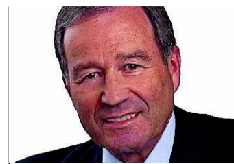
Reserven unsinnig verpufft

Die 40 Mrd. Franken, die unsere Nationalbank 2010 mit unsinnigen Fr.-Stützungsoperationen in den Sand gesetzt hat, fehlen jetzt. Dieses Geld hätte man weit besser zur Absicherung von Währungsrisiken der Exportwirtschaft und des Inland-Tourismus eingesetzt. Nun fehlt es! Man kann als kleines Land seine Währung im Alleingang gegen eine globale Marktmacht ohnehin nicht stützen. Wahrscheinlich hätte eine Absprache mit Staaten wie Norwegen, Schweden, Japan oder Brasilien mehr gebracht. Nun gilt es, mit aller gesetzgeberischen Kraft dafür zu sorgen, dass Importgewinne an Wirtschaft und Verbraucher weitergegeben werden.