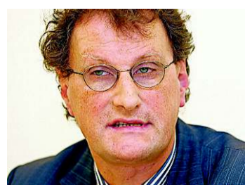
Demokratie in den Firmen

Neu ist, dass nicht nur arme Staaten überverschuldet sind, sondern auch deren Lehrmeister, die totalen Liberalismus predigten. Ein paar tausend Leute besitzen heute mehr Kapital als alle Staaten. Folge einer weltweiten Steuerabbaukampagne. Darunter leiden v. a. die Menschen, die arbeiten. Mit den eingesparten Geldern spielen die nun Casino und verwetten unsere Einlagen. Was tun? Mehr Demokratie in den Firmen, progressive Steuern, Spekulanten aus dem Spiel nehmen.