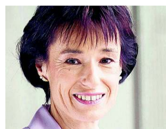
Für ein Wechselkursziel

Währungspolitik darf als Aufgabe der unabhängigen SNB nicht verpolitisiert werden. Trotz Inflationsrisiko bin ich für die Definition eines Wechselkursziels mit einer Untergrenze zum Euro. Politisch ist das Wettbewerbsrecht durchzusetzen, Währungsgewinne sind an Konsumenten und Unternehmen weiterzugeben. Zur Erhaltung der Arbeitsplätze unterstütze ich Bürokratieabbau, steuerliche Entlastungen für Innovationen und die Exportrisikoversicherung.