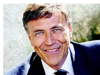
Goldverkauf war ein Fehler

Vor allem die SNB ist gefordert. Sie darf sich aber keinesfalls in die verantwortungslose Politik der USA und EU einbinden lassen, die ihre Währungen ruinieren. Bei Ausweitung der Geldmenge wäre es wichtig, einen Teil der Mittel (auch) in Sachwerte zu investieren. Die SNB darf nur Schweizer Interessen verfolgen. Auf Druck des Auslands «Rettingfallschirme» mitzufinanzieren und Staatsanleihen zu kaufen, ist falsch. Es war ein kapitaler Fehler, die Goldreserven zu verkaufen.