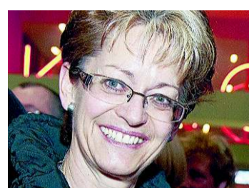
SNB nicht verpolitizieren

Die SNB darf nicht verpolitisiert werden, ihre Unabhängigkeit muss bleiben. Rasches und konsequentes Handeln ist jedoch zwingend, die Lage wurde lange unterschätzt. Die Schweiz darf nicht zum Spielball von Spekulanten werden. Währungsgewinne müssen sofort an Konsumenten weitergegeben werden. Dafür braucht es Preisüberwachung und Weko. Auch dürfen Arbeitszeiterhöhungen bei genügender Auftragslage sowie vorübergehende Inflation kein Tabu sein.