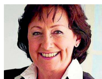
Die Wirtschaft entlasten

Ein starker Franken ist Ausdruck des Vertrauens in unser Land. Es ist die Aufgabe der SNB, dafür zu sorgen, dass dies nicht zu unserem Schaden wird. Gleichzeitig müssen wir dafür sorgen, dass gewisse erleichternde Massnahmen für die Wirtschaft, vor allem auch für die Exportwirtschaft getroffen werden: Der rasche Abbau von einschränkenden Gesetzesbestimmungen, Steuererleichterungen, tiefe Gebühren, Abgaben und Reduktion der Energie- und Transportkosten.