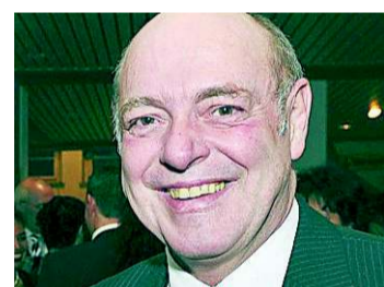
Negativzinsen tun not

Warum hat die Welt nur noch Vertrauen in die Schweiz? Warum fliessen riesige Geldströme in unser Land? Sicherheit, Stabilität werden in schwierigen Zeiten einer hohen Verzinsung vorgezogen. Die Seriosität unseres unabhängigen Landes strahlt uns unberechtigt. Die EU ist am Boden! Negativzinsen und eine vorübergehende Erhöhung der Geldmenge tun leider not. Verlorene Arbeitsplätze werden später nur schwerlich geschaffen. Der Bundesrat sollte endlich entscheiden!