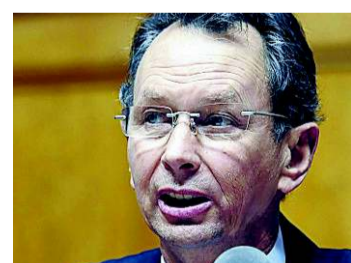
Wenn, dann konsequent

Zuständig für die Währungspolitik ist einzig die SNB. 2009 und 2010 hat sie für 191 Milliarden Franken ausländische Devisen gekauft. Trotzdem ist der Frankenkurs weiter gestiegen. Eine Schwächung des Frankens ist nur über eine massive Geldmengen-Ausweitung und Interventionen am Devisenmarkt zu erreichen. Wenn, dann müsste dies mit aller Konsequenz durchgezogen werden. Die Risiken einer solchen Aktion sind enorm. Das bedeutet Inkaufnahme von Inflation.