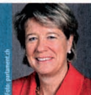
Contra: Corina Eichenberger-Walther ist Nationalrätin FDP des Kantons Aargau.

zischen Hilfeleistungen. Subsidiär ist es eine Geburt mit der Möglichkeit, dem Kind die Identität der Mutter zu einem späteren Zeitpunkt und mit ihrem Einverständnis bekannt zu geben, wodurch den diesbezüglichen Kindesrechten (UN-Kinderkonvention, Bundesverfassung) möglichst weitgehend Rechnung getragen wird. Bildlich gesprochen: Mit Umsetzung meiner Initiative sollte das Babyfenster juristisch unanfechtbar gemacht und von der Spitalmauer ins Spital hinein verlegt werden.