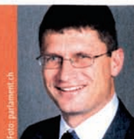
Pro: Reto Wehrli ist Nationalrat CVP des Kantons Schwyz.

Unsere Beratungseinrichtungen und sozialen wie rechtlichen Institutionen bieten bereits heute weitgehende Möglichkeiten, um diesen Problemen zu begegnen und Lösungen für die Mutter und das Kind zu suchen. Nebst der Beratung steht die Freigabe zur Adoption